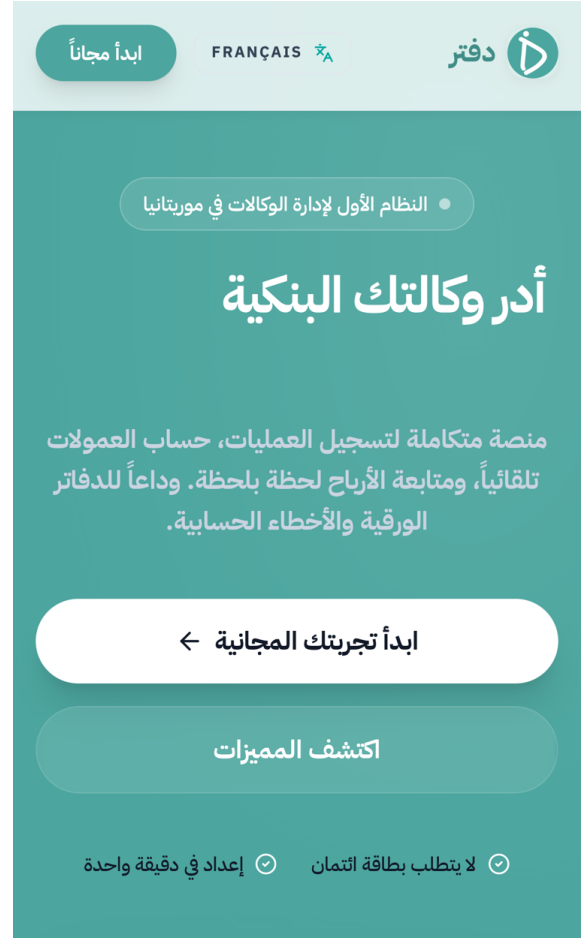
الصفحة الرئيسية لتطبيق دفتر — diftar.online

افتح متصفح الإنترنت لديك واكتب في شريط العنوان رابط التطبيق diftar.online. ستظهر الصفحة الرئيسية بشعار «دفتر» وعنوان «أدر وكالتك البنكية». في أعلى يسار الشاشة تجد زرّ «ابدأ مجاناً» الذي ينقلك إلى صفحة الدخول وإنشاء الحساب. في وسط الصفحة أيضاً زرّ «ابدأ تجربتك المجانية» الذي يقوم بنفس الوظيفة.